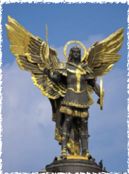
Statue of St. Michael the Archangel that stands above Kyiv's Independence Square. St. Michael is patron saint of the Ukrainian capital.